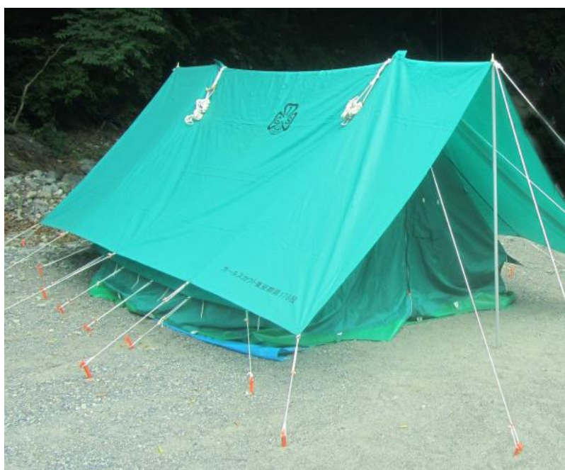
キャンプで使用するテント

・ スカウト保護者は、ガールスカウト東京都連盟が行っている講習を受けることができます。また、資格をとればリーダーとして活動することができます。子育てをする上で非常に有意義な講習ですので、皆さまにご参加をお勧めしています。